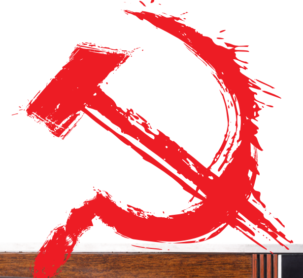
Старі та нові назви населених пунктів