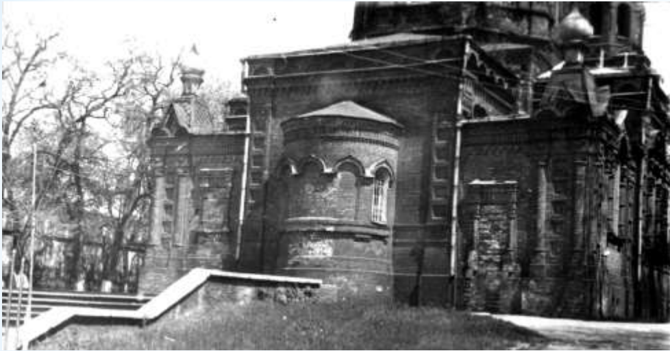
Собор у середині 1980-х років

1984 р. - музей перейшов до нової будівлі, приміщення церкви звільнили.