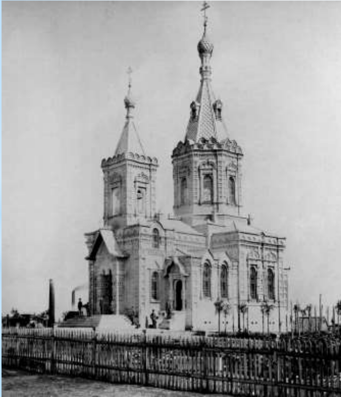
Свято-Миколаївська церква Кам'янського (фото 1896 р.)

1 січня 1920 р. Кам'янське остаточно перейшло під владу більшовиків