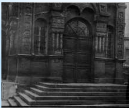
Вхід до музею

25 жовтня 1943 р. від окупантів звільнено Кам'янське, яке з приходом радянської влади знову стало називатися Дніпродзержинськом. Під час визвольних боїв був зруйнований південно-західний боковий вхід до Собору.