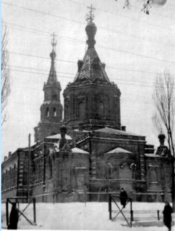
Свято-Миколаївський Собор між 1941 - 1960 роками

23 серпня 1941 р.- війська нацистської Німеччини захопили Дніпродзержинськ.