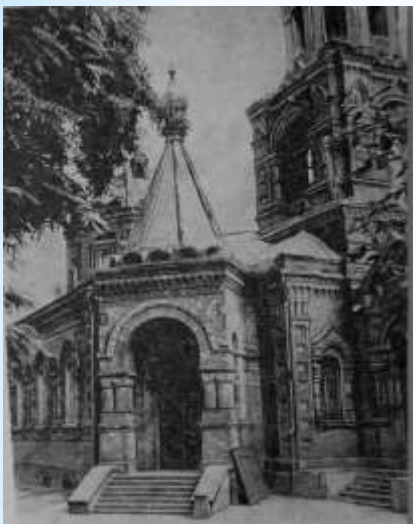
Музей у церкві