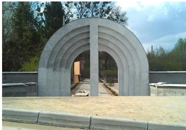
Меморіал Пам'яті жертв Голокосту

Меморіал має велике значення для міста в історичному аспекті. Адже це єдине відоме та доступне місце загибелі великої кількості євреїв, які зазнали переслідувань від фашистів за національними ознаками. Для всіх хмельничан, які хочуть вшанувати пам'ять загиблих під час Голокосту євреїв, варто знати, що на єврейські поховання не прийнято приносити квіти. Замість цього покладіть на могилу звичайний невеличкий камінчик.