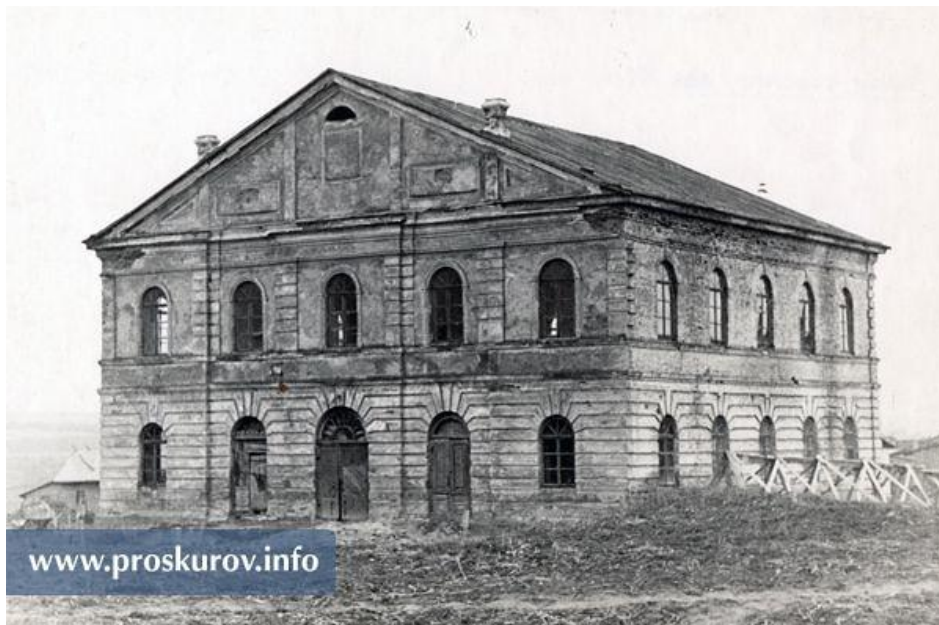
Велика хоральна синагога