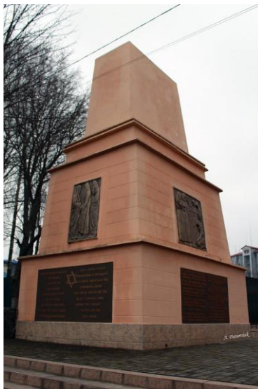
Пам'ятник жертвам проскурівського погрому