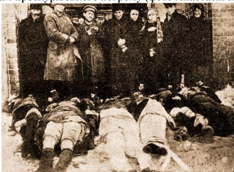
Жертви Проскурівського погрому