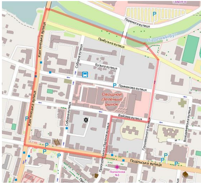
Проскурівське гетто