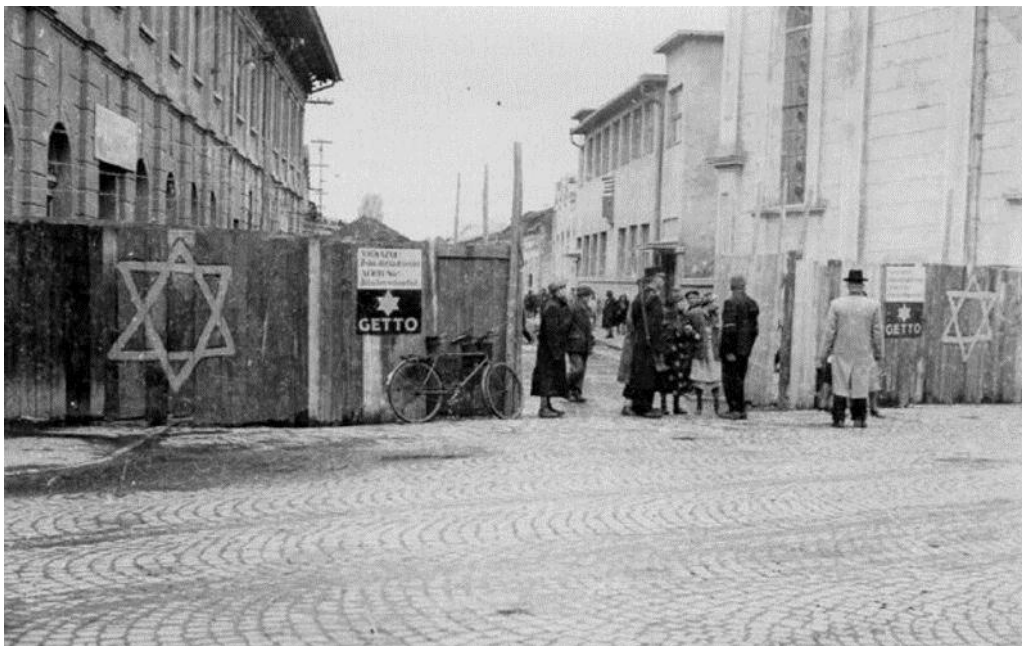
Вхід до Проскурівського Гетто (фото з Вікіпедія https://uk.wikipedia.org/wiki/Проскурівське_гетто )