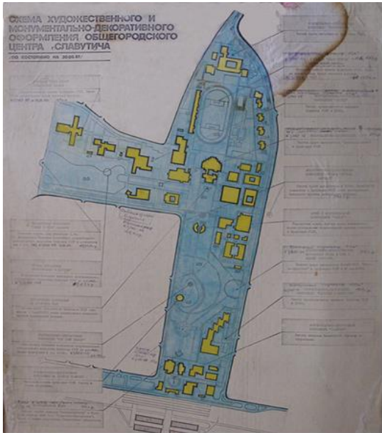
Схема художнього і монументально-декоративного оздоблення Славутича від 1987 року

Пізніше, на жаль, архів був затоплений, й оригінали певних документів втрачено назавжди. Повна інформація з цієї теми навіть відсутня у Відділі архітектури міста з причини відсутності належних умов для зберігання архівних документів.