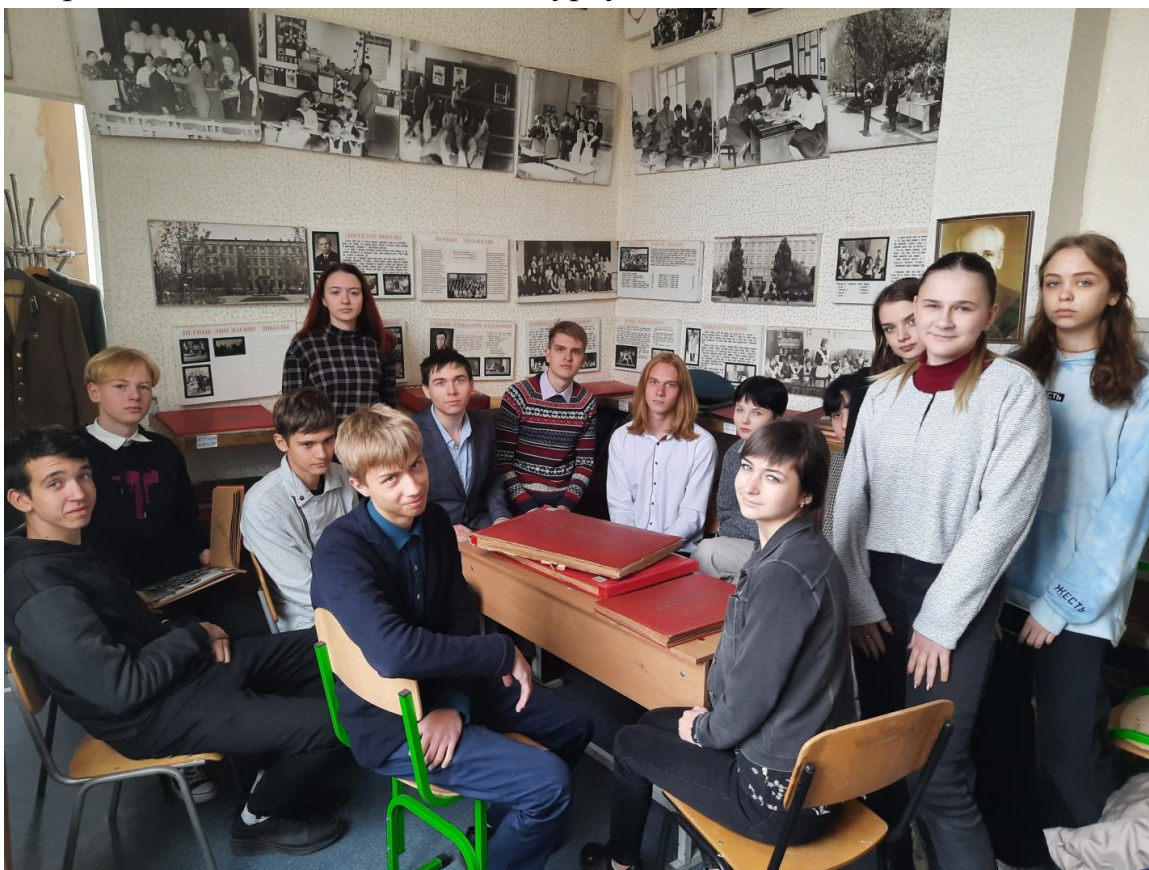
Шкільний музей Маріупольської гімназії №2.

У жовтні місяці ми дізналися про проведення конкурсу «Радянське минуле: (пере)осмислення історії». Ознайомившись з умовами конкурсу, учні одразу звернули увагу на те, що тема, яку ми розглядали напередодні якнайкраще відповідає тематиці конкурсу.